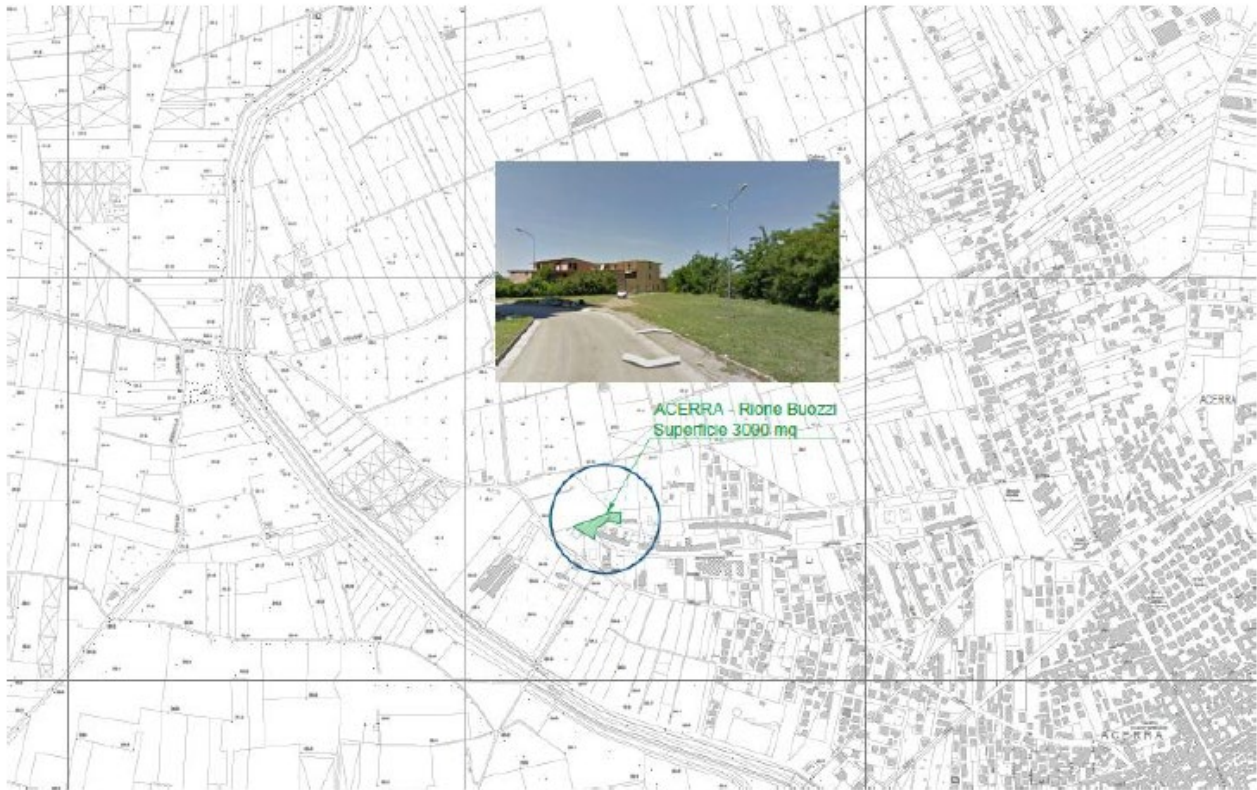
Figura 1. Collocazione territoriale area di intervento

Si riporta di seguito l'inquadramento satellitare del sito e del complesso.